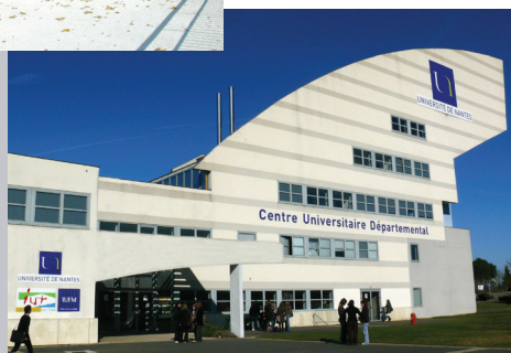
Campus de la Courtaisière (La Roche-sur-Yon)