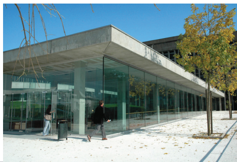
Campus Tertre (Nantes)